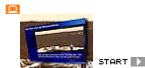
360°-Blick über die Marsoberfläche

Die Forschungsmission solle rund zehn Millionen Euro kosten, teilte AMSAT am Samstag in Bochum mit.